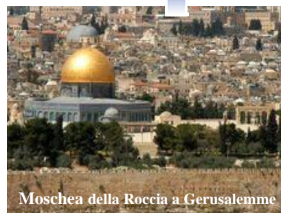
Moschea della Rocca a Gerusalemme