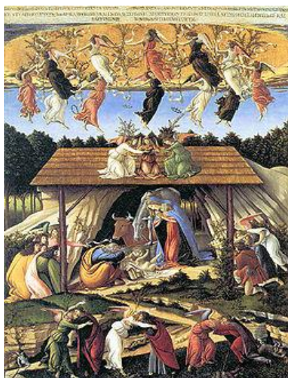
La natività mistica, 1501, Londra, National Gallery