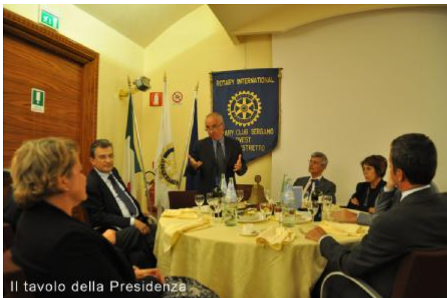
Il tavolo della Presidenza

che con essi con essi la Chiesa aveva firmato una sorta di cambiale in bianco, concedendo immediatamente il proprio riconoscimento del Regno d'Italia come Stato legittimo e di Roma come sua capitale e restando invece in fiduciosa attesa dell'effettiva