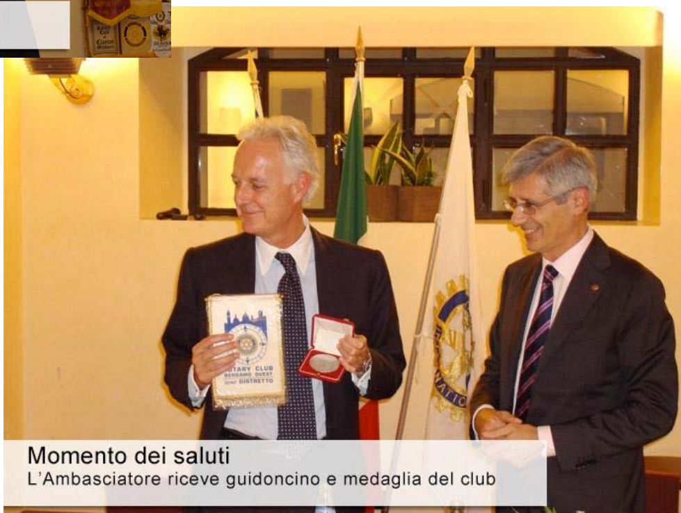
Momento dei saluti L'Ambasciatore riceve guidoncino e medaglia del club

La Repubblica del Montenegro è un Paese vicino fisicamente all'Italia (un'ora di volo da Milano) e molto legato al nostro Paese tanto per ragioni storiche (dal 1420 al 1797 la sua parte costiera ha costituito la cosiddetta Albania veneta, unica enclave balcanica mai sottomessa dai Turchi, mentre nel secolo scorso ha dato all'Italia una Regina), quanto per le attuali relazioni politiche (già ottime, ma ulteriormente rafforzate dalle recenti visite del Presidente del Consiglio Silvio Berlusconi e del Ministro dello Sviluppo Economico Scajola) e commerciali (l'Italia è il primo partner commerciale del Montenegro e i turisti italiani che visitano il Paese sono aumentati del 78% nell'ultimo anno rispetto all'anno precedente). Eppure, il Montenegro è al tempo stesso un Paese inespugnabilmente ancora al di fuori dell'immaginario collettivo italiano, al punto che a una domanda posta a bruciapelo molti Italiani dimostrano di ignorare che tra la costa della Croazia e quella dell'Albania, si inseriscono 300 chilometri meravigliosi di costa montenegrina, con al centro la profonda insenatura delle Bocche di Cattaro, proclamata Patrimonio dell'umanità dall'U-