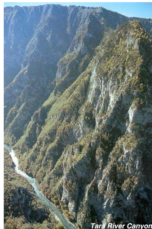
Tara River Canyon