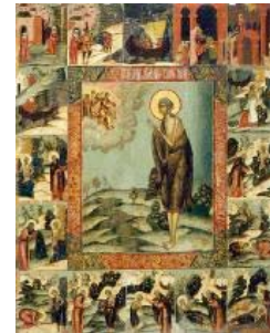
Icona russa del XVII secolo con scene della vita di santa Maria Egziaca