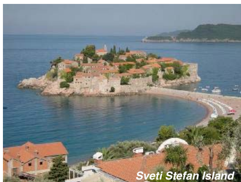
Sveti Stefan Island

"Il Montenegro. Situazione attuale e opportunità imprenditoriali e turistiche"