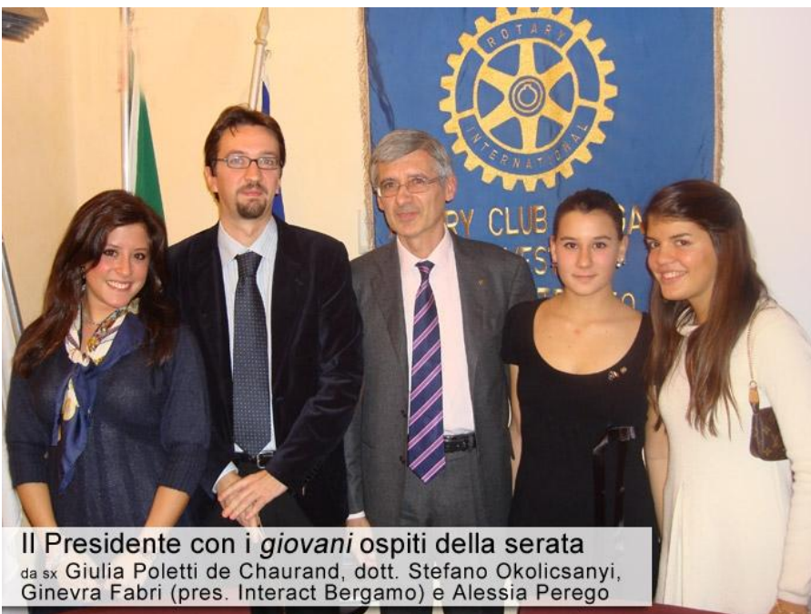
Il Presidente con i giovani ospiti della serata