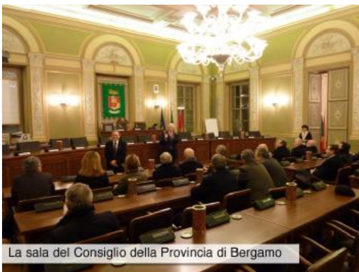
La sala del Consiglio della Provincia di Bergamo