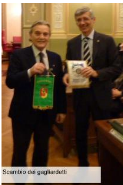
Scambio dei gagliardetti