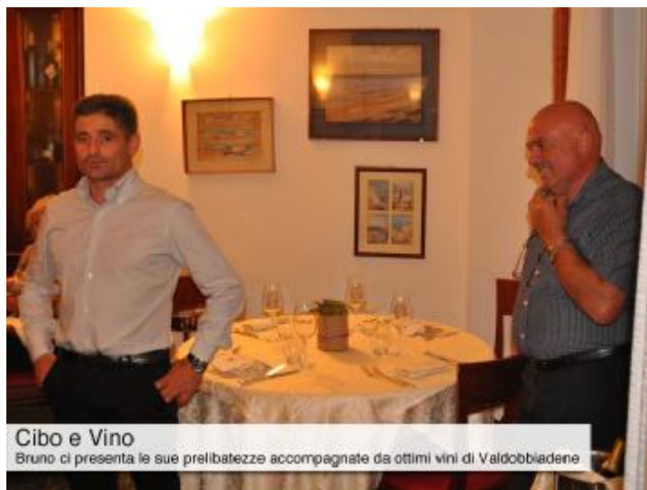
Cibo e Vino Bruno ci presenta le sue prelibatezze accompagnate da ottimi vini di Valdobbiadene

Ancora una volta, i “sapori del golfo”, sono stati i protagonisti della tavola e la conviviale ha rappresentato la migliore occasione d’augurio di buon ritorno ai ritmi serrati che caratterizzano ormai la quotidianità di ognuno e rendono tanto più preziose queste “oasi” di gusto e piacevole conversazione che, come era naturale attendersi, ha spaziato