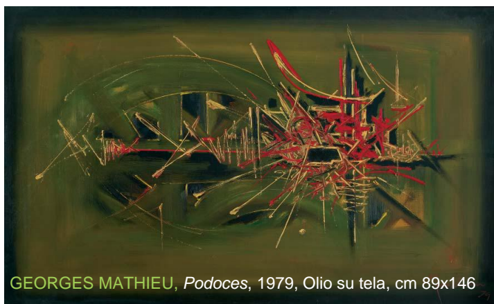
GEORGES MATHIEU, Podoces , 1979, Olio su tela, cm 89x146

Alla presenza di un buon numero di soci, accompagnati dalle gentili consorti e da un figlio (il mio), si è svolta venerdì scorso l'inaugurazione della settima edizione di Bergamo Arte Fiera , mostra mercato di Arte Moderna e Contemporanea allestita alla Fiera Nuova di Bergamo.