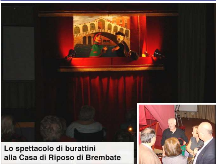
Lo spettacolo di burattini alla Casa di Riposo di Brembate