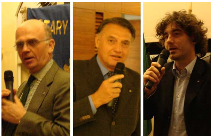
Parliamo di Rotary

Tre interventi sui progetti di club e sulle novità del Rotary a livello distrettuale ed internazionale