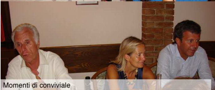
Momenti di conviviale