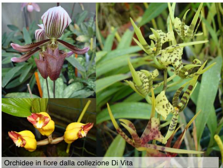
Orchidee in fiore dalla collezione Di Vita

Ho avuto il privilegio di fotografare le orchidee in fiore. Osservare attraverso l'obiettivo di una macchina fotografica apre ad una nuova dimensione. Non sono un fotografo professionista, ma questa passione è scritta nel mio DNA, e ogni volta che mi capita di concentrarmi dietro l'obiettivo riesco a leggere con più