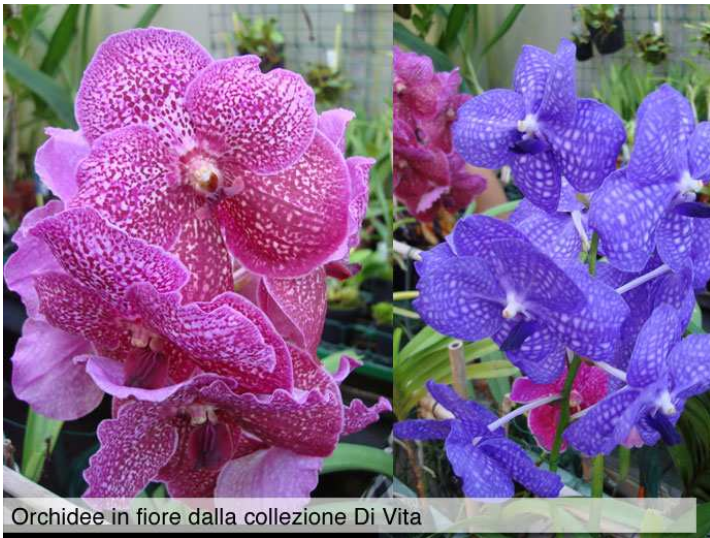
Orchidee in fiore dalla collezione Di Vita

è riferito ai 2 tubercoli radicali presenti in molte piante di questa famiglia che crescono nei nostri climi. Le orchidee sono diffuse in quasi tutti gli ambienti, dalle foreste equatoriali alla tundra, dalle foreste umide delle montagne tropicali alle regioni subdesertiche, dalla riva del mare al limite della vegetazione