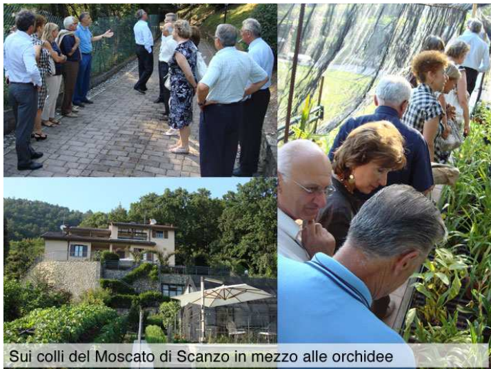
Sui colli del Moscato di Scanzo in mezzo alle orchidee

Messaggio rivolto a tutti gli ingegneri (del club e non): attenzione ai viaggi in Sri Lanka, e se proprio ci dovete andare (e come non consigliarlo?!) evitate di visitare l'Orchid House o preparatevi ad una passione che cambierà la vostra vita.