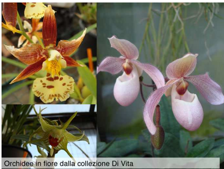
Orchidee in fiore dalla collezione Di Vita

Il nome Orchidee proviene dal termine greco "Orchis", è usato per la prima volta in Europa da Teofrasto (IV-III sec. prima di Cristo), significa testicoli ed