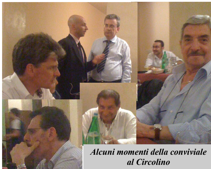
Alcuni momenti della conviviale al Circolino

La mostra, promossa e organizzata dalla Fondazione Bergamo nella storia, grazie al contributo di Comitato Bergamo per i 150 anni, Fondazione ASM e Fondazione Comunità bergamasca, offre al visitatore l'opportunità di ampliare e approfondire i contenuti dell'esposizione di cimeli raccolti nel Museo della Rocca.