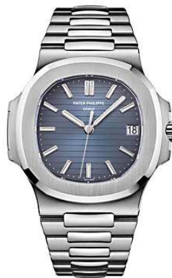
Patek Philippe Nautilus