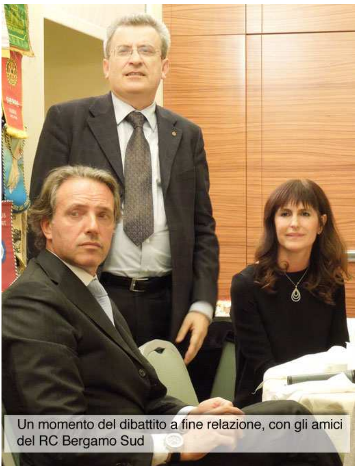
Un momento del dibattito a fine relazione, con gli amici del RC Bergamo Sud