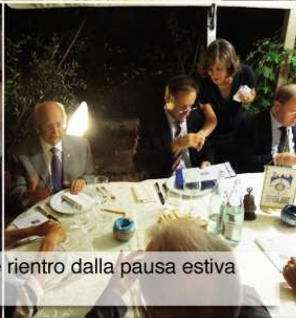
Momenti di convivialità durante il tradizionale rientro dalla pausa estiva alla Caprese

pensare agli appuntamenti Rotariani ed agli impegni che ci aspettano nei prossimi mesi.