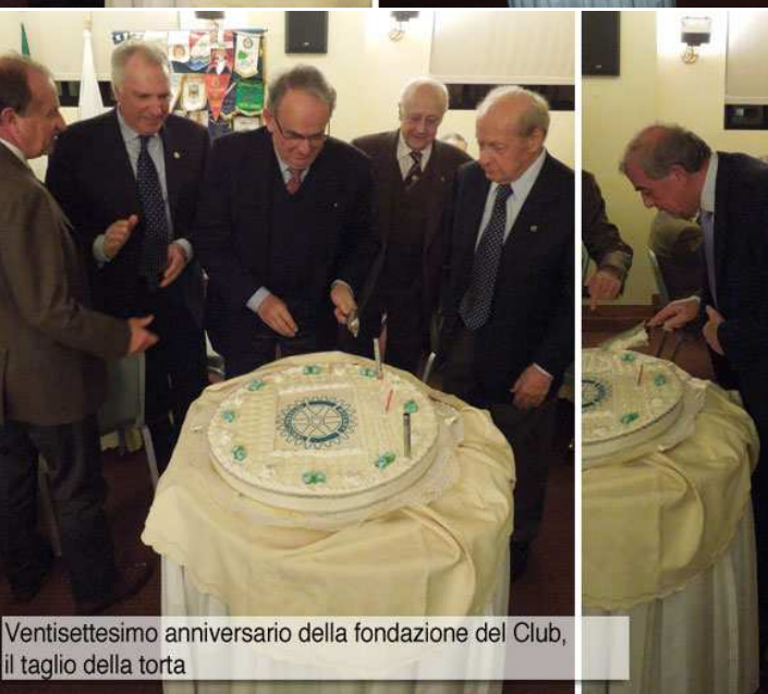
Ventisettesimo anniversario della fondazione del Club, il taglio della torta

La serata si è conclusa con la testimonianza dei soci Renato Cortinovis, Luigi Salvi, Roberto Magri e Ugo Botti che tra ricordi e sogni ci hanno parlato del nostro Rotary. (L. Carminati)