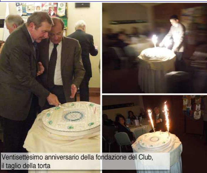
Ventisettesimo anniversario della fondazione del Club, il taglio della torta