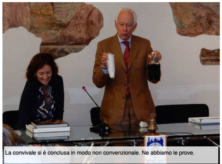
La conviviale si è conclusa in modo non convenzionale. Ne abbiamo le prove.