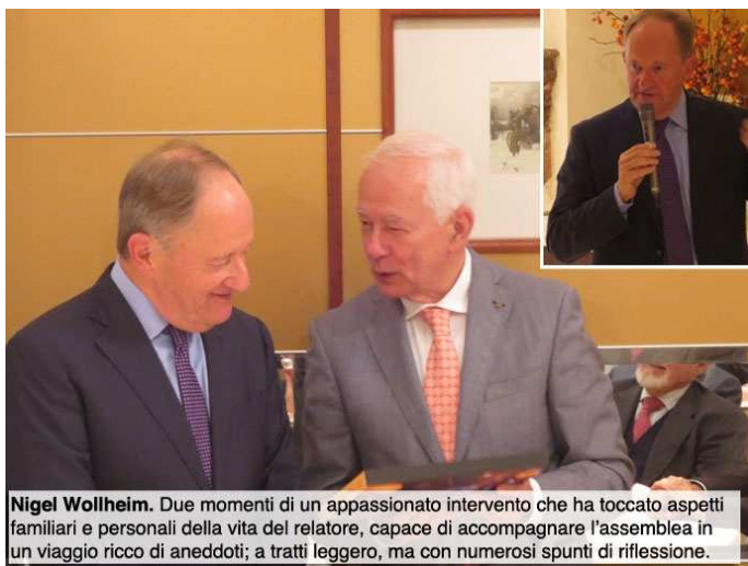
Nigel Wollheim. Due momenti di un appassionato intervento che ha toccato aspetti familiari e personali della vita del relatore, capace di accompagnare l'assemblea in un viaggio ricco di aneddoti; a tratti leggero, ma con numerosi spunti di riflessione.

Relatore Nigel Wollheim. Nigel oggi lavora con la Scuderia Ferrari, ma la sua avventura in Formula 1 comincia con la Toleman ad Imola nel 1981