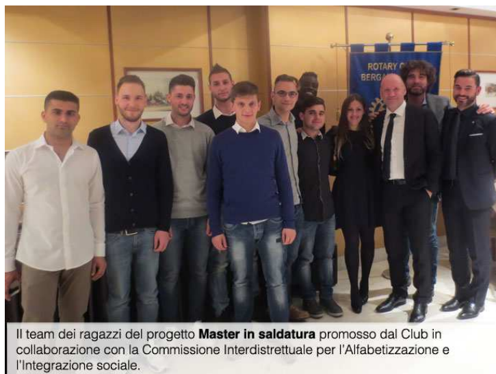
Il team dei ragazzi del progetto Master in saldatura promosso dal Club in collaborazione con la Commissione Interdistrettuale per l'Alfabetizzazione e l'Integrazione sociale.