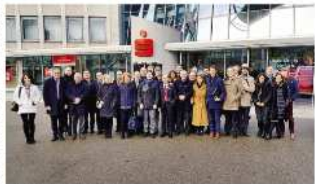
La delegazione bergamasca davanti alla sede della Sparisone di Ludwigsburg

«Una missione esplorativa, di lavoro e di incontro».