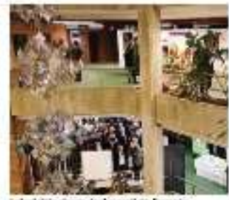
I piani del palazzo che ha ospitato l'evento