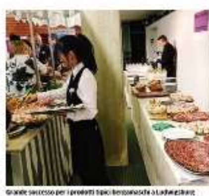
Grande successo per i prodotti tipici bergamaschi a Ludwigsburg

Bergamo rimane l'ospite durante al Landkreis una serata di Artichino, opera di Godeo Sardi. «Tra poco tornerà un archivio di lavoro e di incontro».