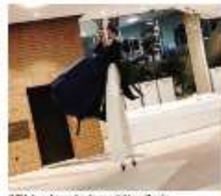
Il Tib in azione al palazzo del Landkreis