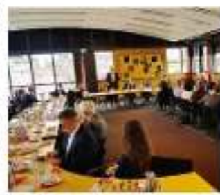
I lavori bilaterali di confronto