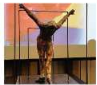
La statua di Artichino, opera di Godeo Sardi