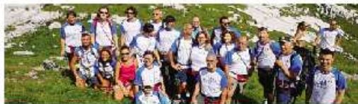
I soci del club Rotary distretto 2042

durante la cordata, pubblicate sul sito di Orobie, il mensile dedicato alla montagna del gruppo editoriale de L'Eco di Bergamo, e in parte nei giorni successivi. Sono immagini che raccontano la passione per l'escursionismo, la festa, l'amicizia e la soddisfazione di aver fatto parte di un evento unico.