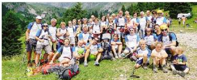
Gamass, Gruppo amici della montagna di Almenno San Salvatore, presenti in 51