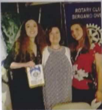
La consegna del premio